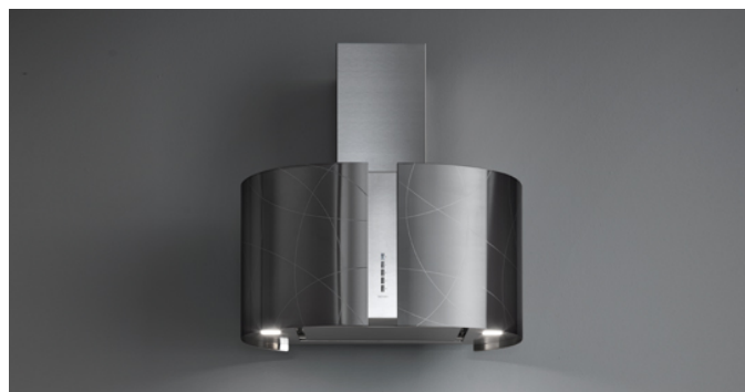
Immagine indicativa del prodotto Potrebbe non corrispondere alla versione selezionata